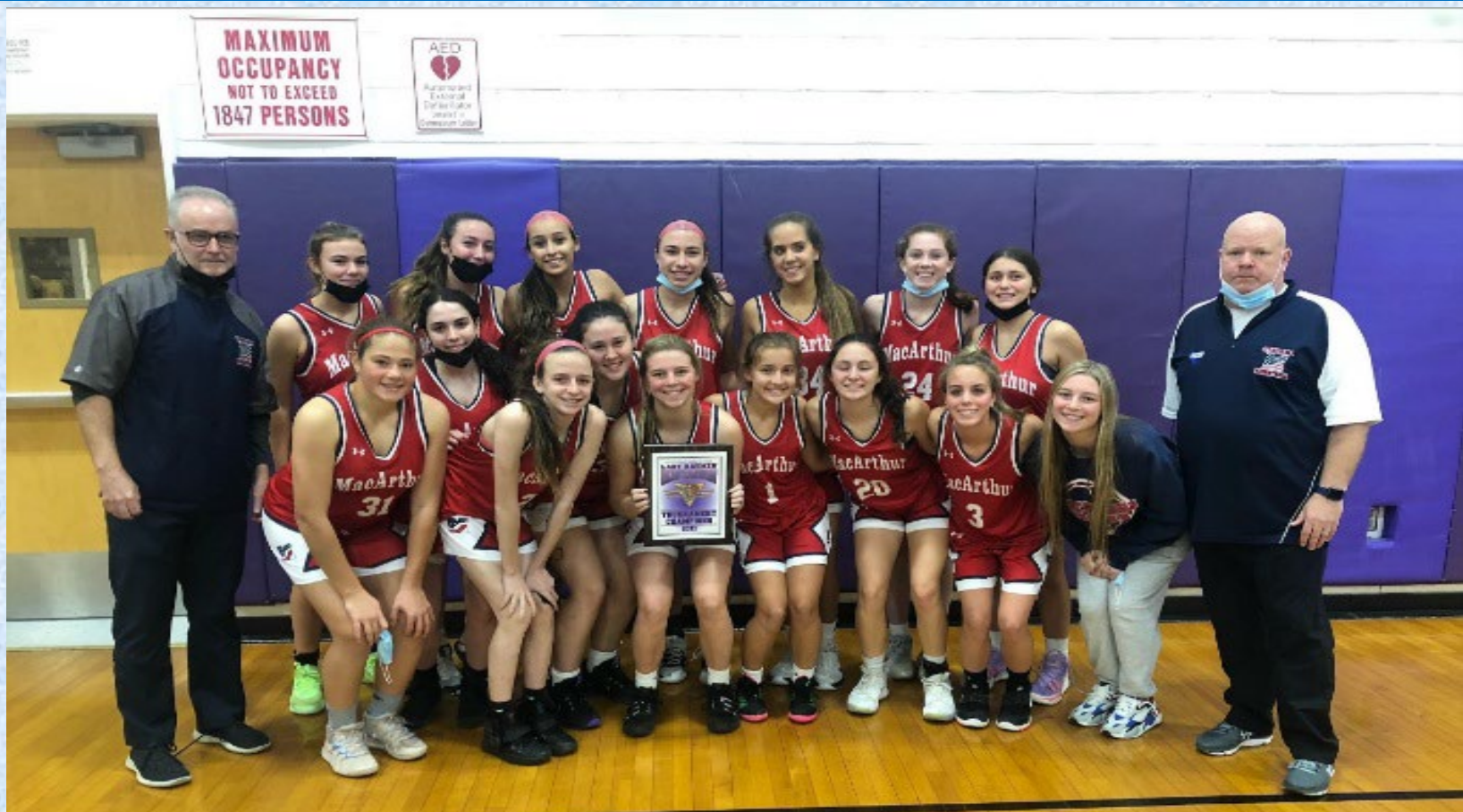
MacArthur Campeonas de la liga de baloncesto